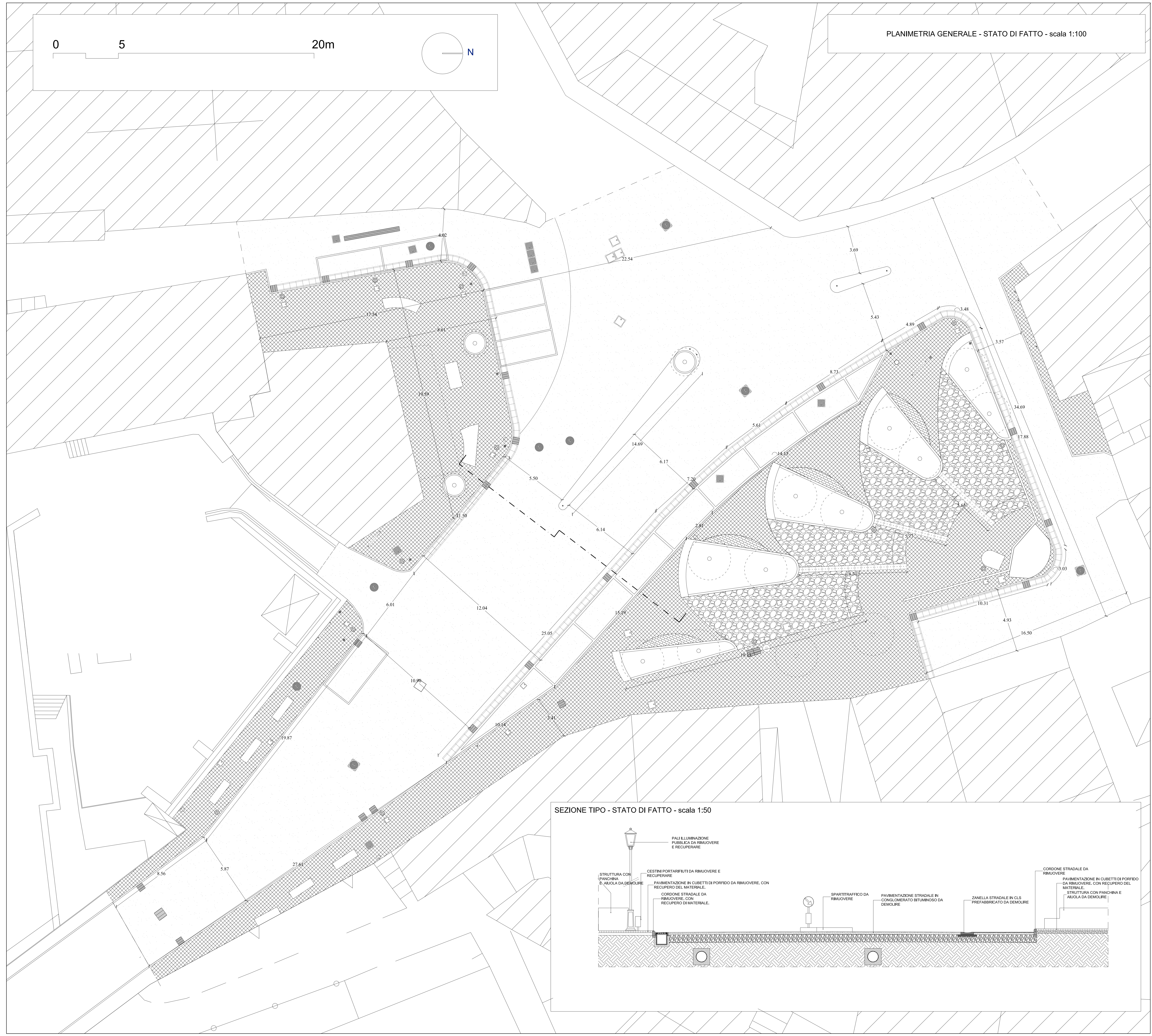
PLANIMETRIA GENERALE - STATO DI FATTO - scala 1:100

COMUNE DI MONTE DI PROCIDA - C. 448 - 01 - 0021024 - ing. 27/12/2022 - 10/3